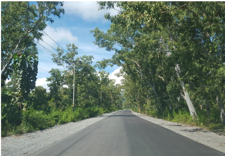
马纳图托-拉克鲁巴道路改造及维护项目

签大型承包工程项目包括中国土木工程集团有限公司承建东帝汶比亚佐液化天然气厂港口设施项目；中国武夷实业股份有限公司承建东帝汶劳拉雷至索利雷马项目等。主要工程承包项目包括上海建工集团股份有限公司承包东帝汶警察局大楼；中铁国际集团有限公司承包东帝汶包考-维可公路项目；上海建工集团股份有限公司承包东帝汶小型道路项目等。东帝汶工程项目大都采用欧美标准。项目设计方案并非由中国企业制作，因此中国标准较难被采用，也没有来自中国的项目监理。