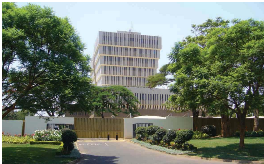
马拉维储备银行总部大楼

马拉维主要商业银行有：马拉维国家银行、马拉维标准银行、马拉维第一商业银行、莱德银行、经济银行、印迪银行和新建筑协会银行等。其中马拉维国家银行（NBM）为马拉维第一大银行，在全国拥有数十家分行和上千名员工。马拉维标准银行为南非标准银行控股的外资银行，是仅次于马拉维国家银行的第二大银行。目前该行与中国工商银行等金融机构有比较密切的业务往来。