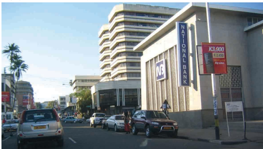
马拉维布兰太尔市商业街

马拉维居民实际生活成本很高。食品通胀率约占马拉维通胀率的50.2%。因此，在房屋、能源、交通等其他生活费用依然很高的情况下，通胀率下降并不能导致普通百姓的生活成本明显下降。马拉维社会问题关注中心（CfSC）数据显示，城市地区一个6口之家月平均最低消费为18.67万克瓦查（约合248美元），而城市地区月最低工资标准仅为2.5万克瓦查（约合33.3美元），赤字达16.1万克瓦查（约合215美元），同比上升4.1%。马拉维消费者协会（Cama）表示，2016年10月，马拉维劳工部将月最低工资标准由1.9万克瓦查（约合25.3美元）提高至2.5万瓦查（约合33.3美元），但由于政府经济政策制定脱离实际、不能有效提高生产力和促进经济发展，生活支出与最低工资标准差距不断拉大，贫富差距悬殊，形势严峻，普通工人难以在城市立足。