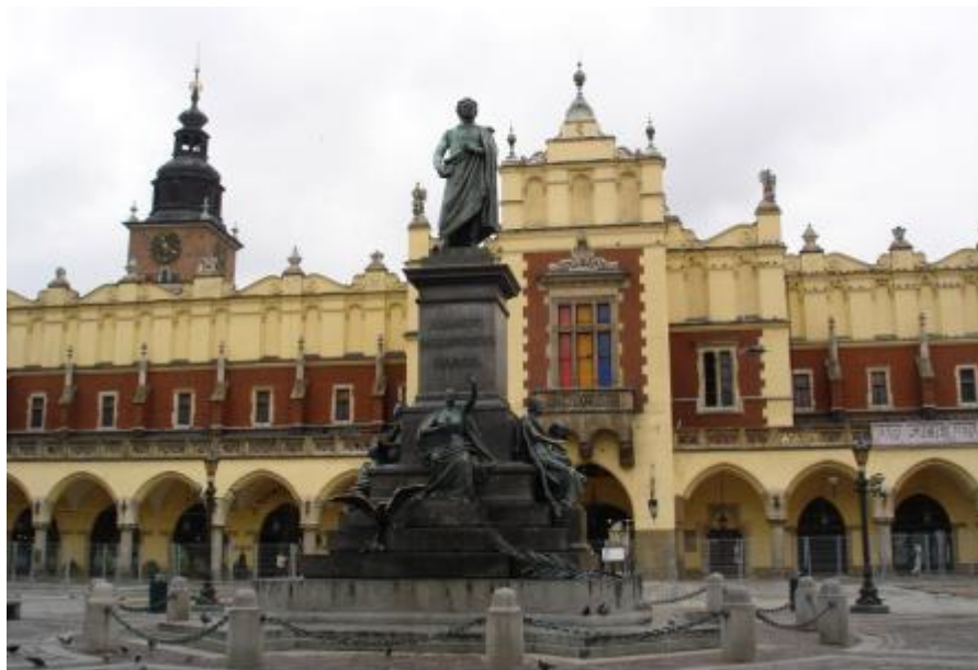
克拉科夫市老城广场

岸维斯瓦河的人海口，人口约58.2万（2017年），是波兰北部最大的城市，与索波特、格丁尼亚两市形成庞大的港口城市联合体——三联轴。其他重要城市还有罗兹、卡托维茨、波兹南等。