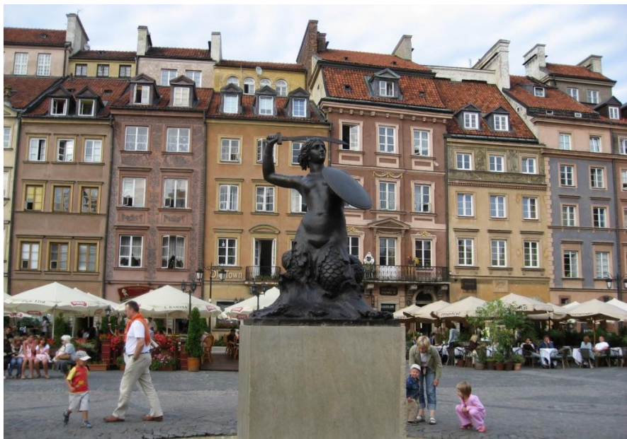
华沙老城广场美人鱼雕像

2019年4月，波兰全国约80%的中小学和幼儿园教师因薪资问题举行罢工，要求政府提高教师收入。