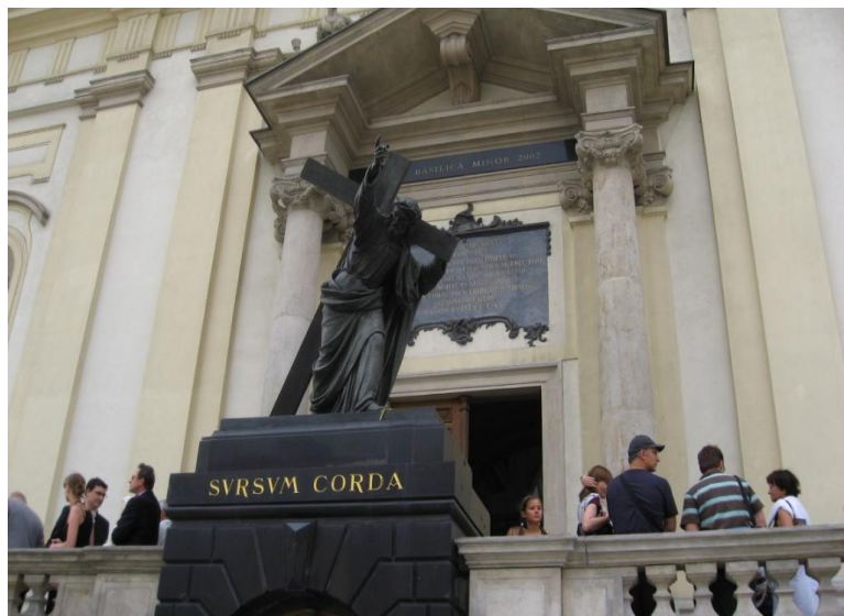
藏有肖邦心脏的圣十字教堂

90%的波兰人信仰罗马天主教，少部分信仰东正教或基督教新教。教会在波兰影响力很大，前罗马教皇约翰·保罗二世被波兰人视为民族骄傲，2014年4月保罗二世被罗马教廷认定为“圣人”。圣诞节是波兰人最重要、最喜爱的节日。